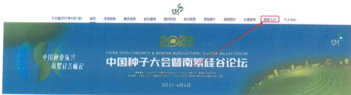
(大会网站注册界面)